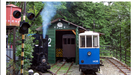
8号機関車とデハ1408号電車(風の峠車庫)