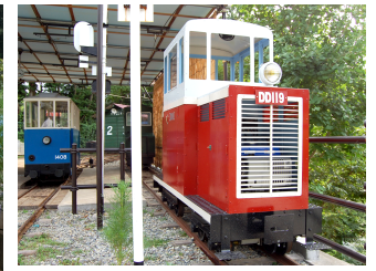
デハ6号電車と7号機関車(桜谷駅) 走行中のキハ3号気動車(桜谷-風の峠) DD11-9 機関車(風の峠駅)