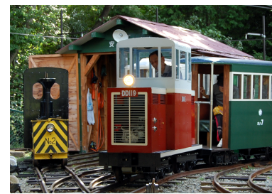
DD11型ガソリン機関車（風の峠駅）