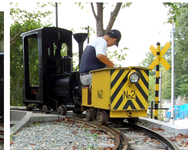
2号機関車と8号機関車（桜谷駅）