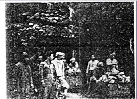
戦時中再開された桜谷鉱山 【大阪朝日新聞 1938年10月14日付】

「1920年（大正九）以降、大阪府下では鉱山の採掘は全くみられなかったが、日中戦争開始後金属の価格が高騰するとともに、ふたたび鉱山採掘の動きがあらわれ、1939年（昭和十四）からは『大阪府統計書』に鉱石販売価格が一万円程あらわれる。吉川村の桜谷鉱山が再開されたのは1938年である。桜谷鉱山は、所在地吉川村、鉱種は銀・銅・亜鉛、坪数28,900坪、1930年（昭和五）に採掘許可を受けている。」 （日本の金属鉱山 http://www.miningjapan.org/mine/sakuradani/ より引用）