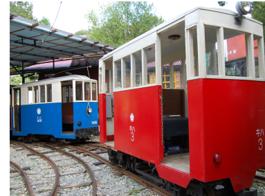
キハ3とモハ1408（風の峠駅）