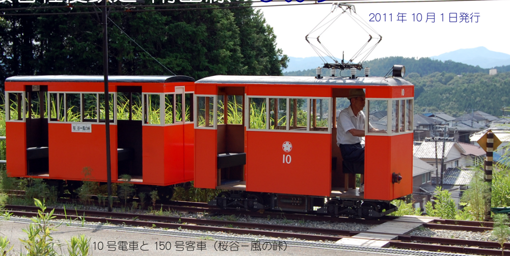
10号電車と150号客車（桜谷-風の峠）

桜谷軽便鉄道南山線は、大阪府豊能町内で運行する、2001年8月に開通した15インチゲージ鉄道です。