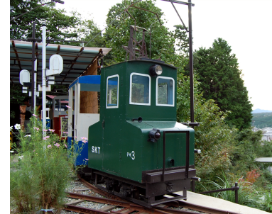
デキ3号電気機関車