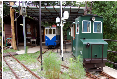
風の峠駅 駅舎と検車庫をループで回る