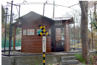
桜谷駅 駅舎を回りこむループがある