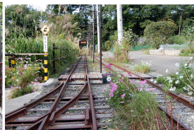
風の峠駅から桜谷駅方向を望む