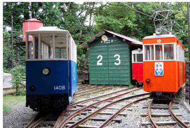
風の峠検車庫 10号電車が走るのとは本線