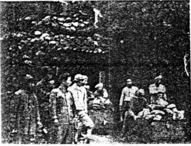
戦時中再開された桜谷鉱山 【大阪朝日新聞 1938年10月14日付】

(日本の金属鉱山 http://www.mining-japan.org/ より)