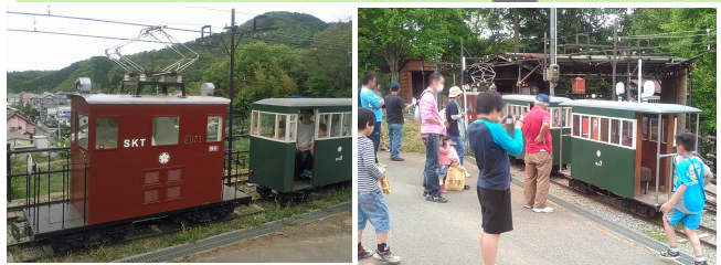
2015年5月に開催された『桜谷まつり』の様子。