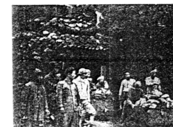
戦時中再開された桜谷鉱山 【大阪朝日新聞 1938年10月14日付】

「1920年(大正九)以降、大阪府下では鉱山の採掘は全くみられなかったが、日中戦争開始後金属の価格が高騰するとともに、ふたたび鉱山採掘の動きがあらわれ、1939年(昭和十四)からは『大阪府統計書』に鉱石販売価格が一万円程あらわれる。吉川村の桜谷鉱山が再開されたのは1938年である。桜谷鉱山は、所在地吉川村、鉱種は銀・銅・亜鉛、坪数28,900坪、1930年(昭和五)に採掘許可を受けている。」(日本の金属鉱山 http://www.miningjapan.org より)