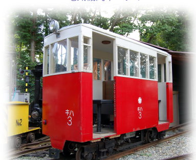
ガソリン動車 キハ3