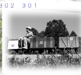
鉱車 20 10(2001年撮影)