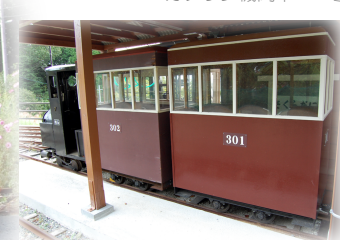
客車 302 301