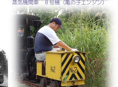
バッテリー機関車 2号機