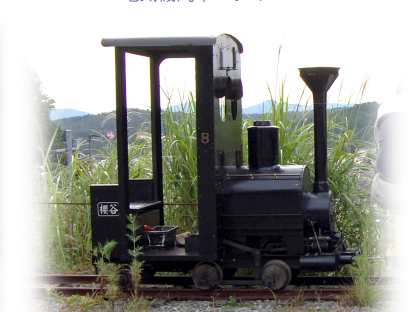
蒸気機関車 8号機 (亀の子エンジン)